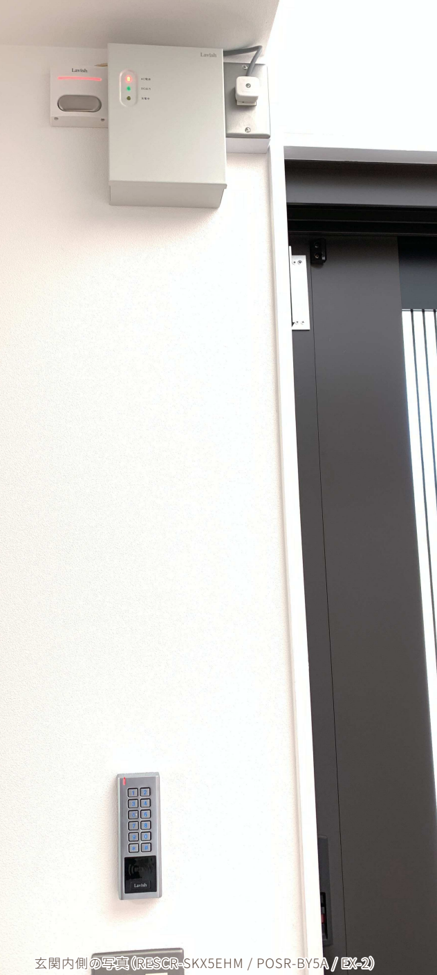
玄関内側の写真 (RESCR-SKX5EHM / POSR-BY5A / EX-2)