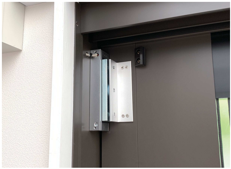
電磁錠部分 (LOE-A180L / BR-A180ZL)

引き戸に電磁錠を設置。コードはドア枠を通して、壁から電源ユニットに綺麗に収められています。こちらの電磁錠は、災害停電等の際には自動で解錠します。